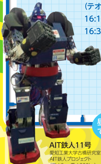
AIT鉄人11号 愛知工業大学古橋研究室 AIT鉄人プロジェクト (高さ2m、重さ200kg)